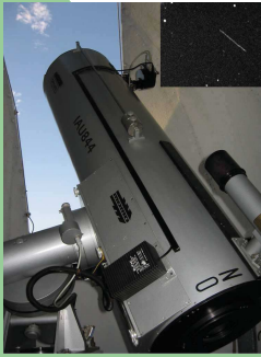
Telescopio 38 cm OALM

Breve introducción para los que ingresan a la Licenciatura en Astronomía, Facultad de Ciencias, UdelaR, Uruguay